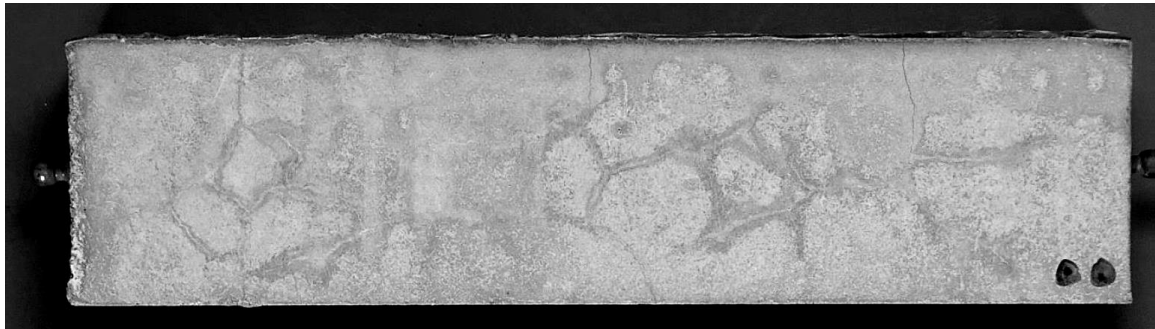
Abb. 3: Probekörper eines EC-Mörtels mit GK 1,0 mm nach KWL mit deutlich sichtbaren Rissen an der Oberfläche der Schalungsseite

Optisch zeigten sich an der Oberfläche dieser Probekörper feine Risse, durch die sich die Reduktion der Biegezugfestigkeit erklären lässt (siehe Abb. 3). Diese Risse könnten durch Quell-/Schwindprozesse aufgrund von Wasseraufnahme/-abgabe oder durch Wärmedehnungsprozesse hervorgerufen worden sein.